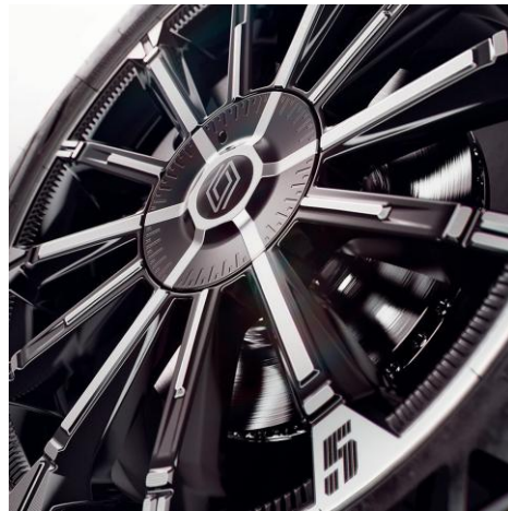
45-cm (18") platišča iz lahke litine Chrono z diamantnim leskom