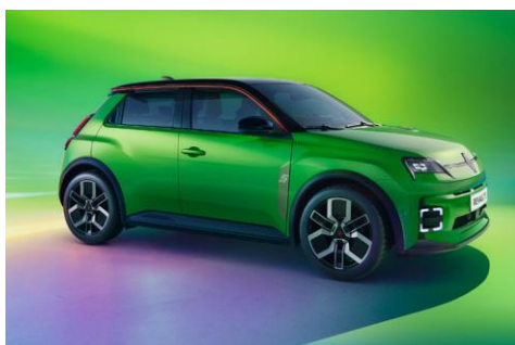
zelena Pop! (1)