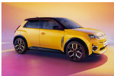
rumena Pop! (1)