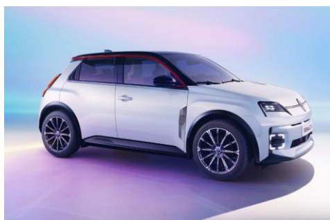
perla bela (3)