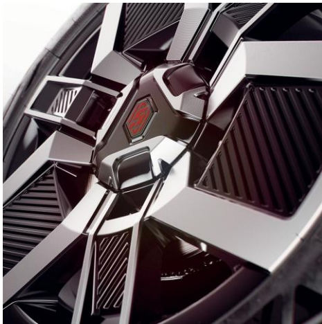
45-cm (18") platišča iz lahke litine Techno z diamantnim leskom