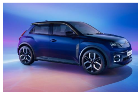
modra Nocturne (2)